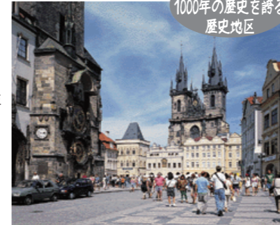
【世界遺産】1000年の歴史を誇る歴史地区

建築の野外博物館とも呼ばれる市内には、様々な時代の建物があるので、建築に注目するのも楽しい街。第一次世界大戦末期に独立を要求するデモが繰り広げられ、「プラハの春」で1968年ワルシャワ条約機構軍の戦車が市民と対峙しました。89年のピロード革命の時には、50万人の市民が集まり、ハヴェルが新政権樹立を宣言しました。