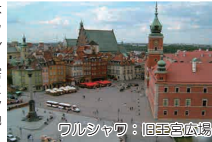
ワルシャワ：旧王宮広場

第二次世界大戦による破壊から不死鳥のごとく蘇った緑豊かなポーランドの首都。中世の街並みを感じさせる佇まいを残す旧市街地区、そして至るところにある戦争被害者の碑に、この国の歴史の重みと市民たちの心を感じます。またシヨパンやキュリー夫人ゆかりの地として有名です。