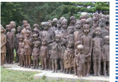
(写真はすべてイメージです)

ナチ親衛隊幹部ラインハルト・ハイドリヒがチェコのレジスタンス勢力にプラハで暗殺されると、報復としてナチはリディツェ村を襲撃する。村民がレジスタンスとの関与を疑われたためだ。村民は全員殺害または強制収容所へ移送された。教会や墓地までも完全に破壊され、村は消滅した。現在、跡地は野原のままにされ、慰霊碑や記念館が建っている。